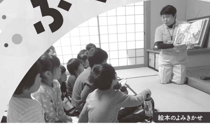
絵本のよみきかせ