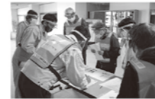
令和3年度の訓練の様子

被災地の生活復旧のためのボランティア活動を支える「災害ボランティアセンター」は社会福祉協議会が設置運営し被災者のニーズとボランティア活動者とを結ぶ懸け橋となります。 今回は、運営経験者による災害ボランティアセンターの役割や機能、また横瀬町の防災についての講義と行動訓練を行います。ぜひご参加ください。 日時 1月19日(日) 9:00~12:00 場所 総合福祉センター 定員 20名 締切 1月10日(金) ※定員になり次第終了 申込先 横瀬町社会福祉協議会(☎22-7380) または総合福祉センター窓口