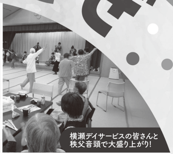
横瀬デイサービスの皆さんと 秩父音頭で大盛り上がり!