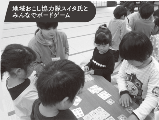
地域おこし協力隊スिता氏と みんなでボードゲーム