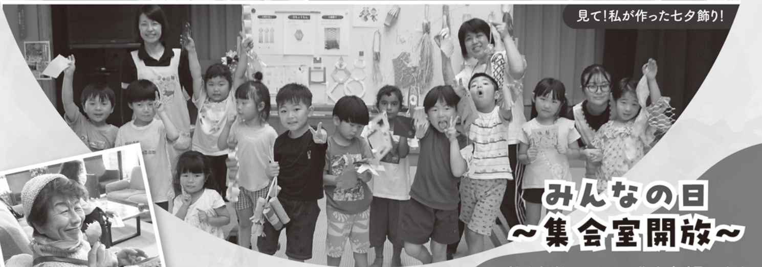
見て!私を作った七夕飾り!