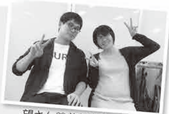
望さん♡美帆さんご夫妻

良いご縁をいただき、秩父で一緒に暮らすこととなりました。良い機会をありがとうございました。