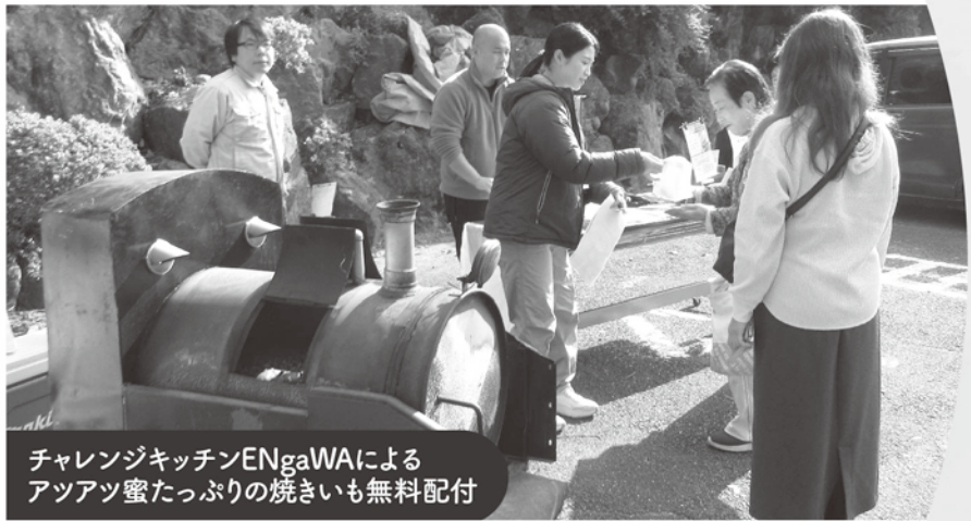
チャレンジキッチンENgaWAによる アツアツ蜜たっぷりの焼きいも無料配付