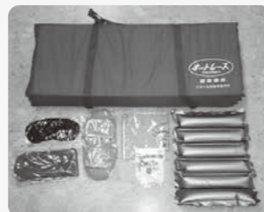
安眠セット(火災時は対象外)